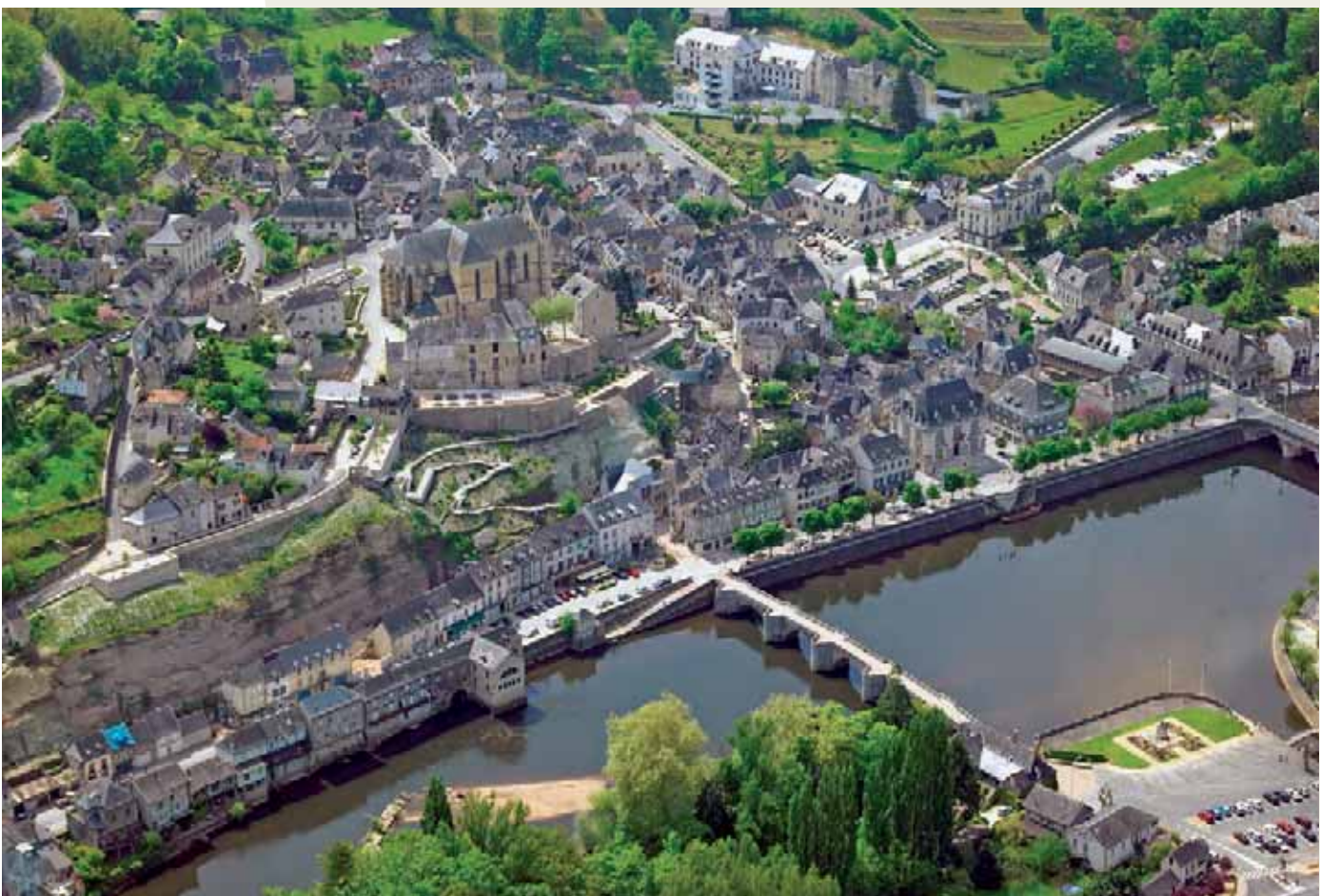
Terrasson, porte de la préhistoire et de la vallée de la Vézère