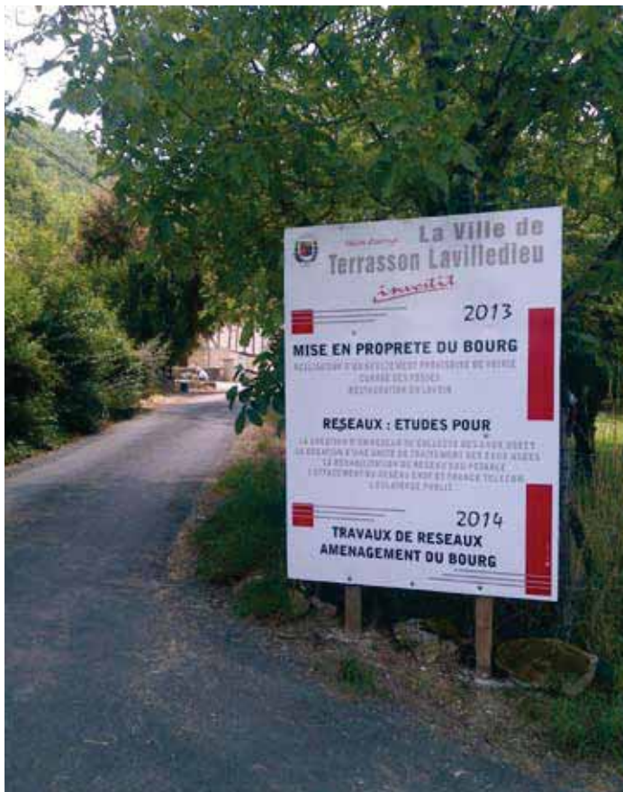
Voirie, réseaux du grand Terrasson, bourgs et hameaux font l'objet de toutes les attentions. Ici, Bouillac.

Vous pourrez découvrir les détails de ces investissements réalisés dans les rubriques « réalisé » et « en cours » du tableau ci-contre.