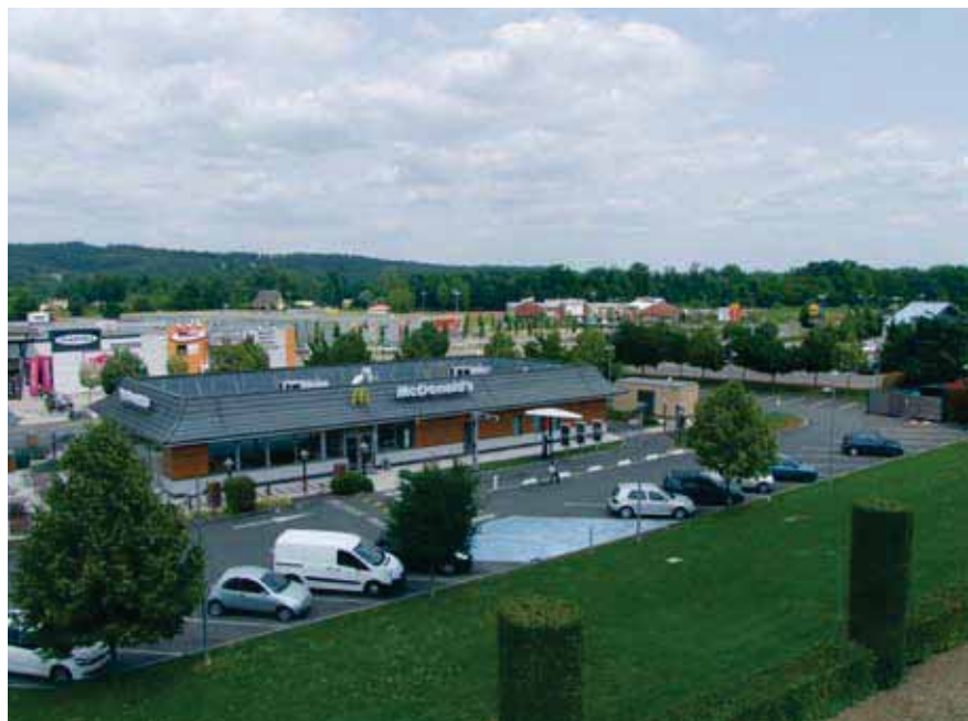
La zone commerciale se développe.

Les chiffres parlent d'eux-mêmes et l'observatoire économique de la Ville, qui accompagne nombre de ces créations, a précisément dénombré 205 locaux commerciaux sur la Ville, avec un taux d'occupation de 90 %.