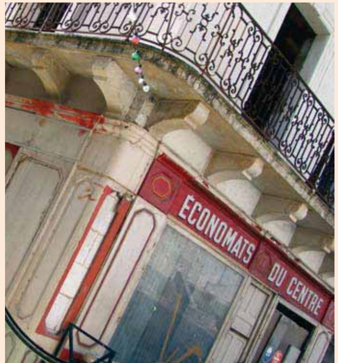
Les échoppes façon XIX e feront du vieux Terrasson un site exceptionnel par son originalité et son architecture, avant la fin de l'année