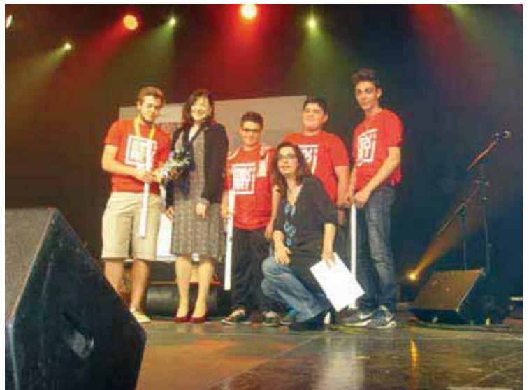
Les jeunes lauréats du concours Mix'art sur la scène du théâtre de Berlin

L'ESPACE JEUNESSE , avenue Jean Jaurès, est ouvert du mardi au vendredi de 16h30 à 18h30 ; mercredi et samedi de 14h à 18h et pendant les vacances scolaires, du mardi au samedi de 14h à 18h.