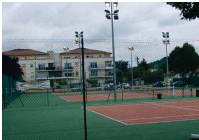
Le club de tennis dispose d'installations de grande qualité (éclairage, club house, vestiaires, parkings...)

Terrasson est une ville sportive, avec une trentaine de clubs et associations et des équipements sportifs municipaux : piscine découverte ouverte à la mi juin pour le perfectionnement des scolaires, de début juillet à mi septembre pour le tout public, un boulodrome avec 16 terrains et un club house, deux terrains de rugby pour l'équipe phare USCT rugby au stade municipal et au terrain des Chauffours pour l'école de rugby, le stade Paul Couvidat et le stade annexe pour le football, des terrains de tennis éclairés, un gymnase ouvert aux établissements scolaires et aux clubs, la salle Eugène Le Roy pour les pongistes... permettant la pratique de nombreuses disciplines.