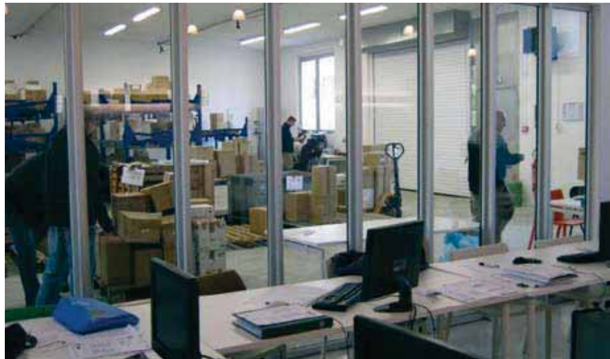
La pépinière des métiers est aussi un lieu de formation, ici une formation qualifiante aux métiers de la logistique.