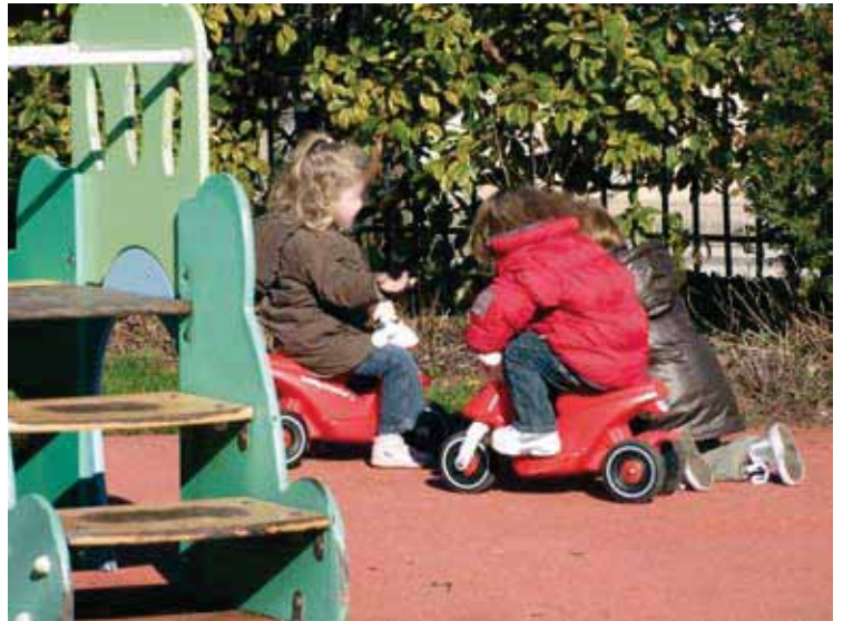
TOM POUCE , route de la Barétie, est ouvert le jeudi matin et le vendredi matin, de 9h00 à 12h00. Il prépare le jeune enfant à l'univers de la crèche.

L'Épicerie sociale/Espace des solidarités , a ouvert en début d'année 2013. C'est un concept cher au Maire inspiré du modèle de l'Espace Economie