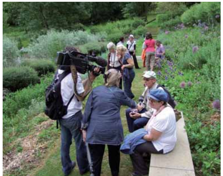
Les Jardins de l'Imaginaire ont eu les faveurs du 13h de TF1

Les Jardins de l'Imaginaire Place de Genouillac 24120 Terrasson Tél. 05.53.50.86.82