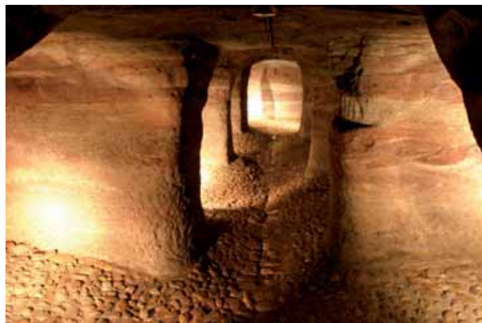
Ces mystérieux cluzeaux