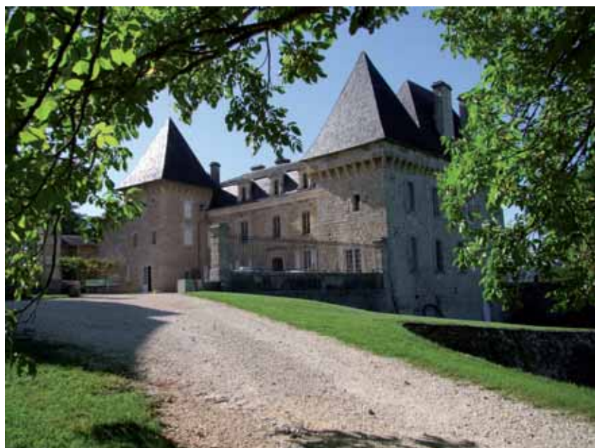
Le château du Fraysse à admirer lors des journées du patrimoine