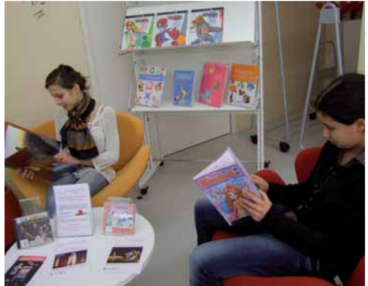
Les jeunes ont pris leurs habitudes à la médiathèque

La Médiathèque est aussi l'occasion de belles rencontres comme celles organisées durant l'année scolaire, avec le concours des documentalistes et des professeurs de français du collège et du lycée, autour de la remise d'un prix littéraire pour les classes de troisième et de seconde. 50 élèves ont sélectionné 5 romans contemporains et 5 auteurs et ont fait un véritable travail autour de ces ouvrages et de leur lecture durant l'année scolaire. Leur choix pour ce premier prix