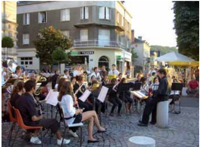
Les mercredis du Bassin

Programme en ligne : centre-culturel-terrasson.fr