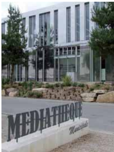
Collégiens et lycéens ont travaillé sur la remise d'un prix littéraire