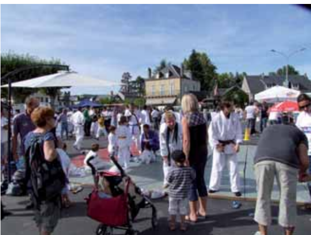
La fête des associations un événement de rentrée très attendu