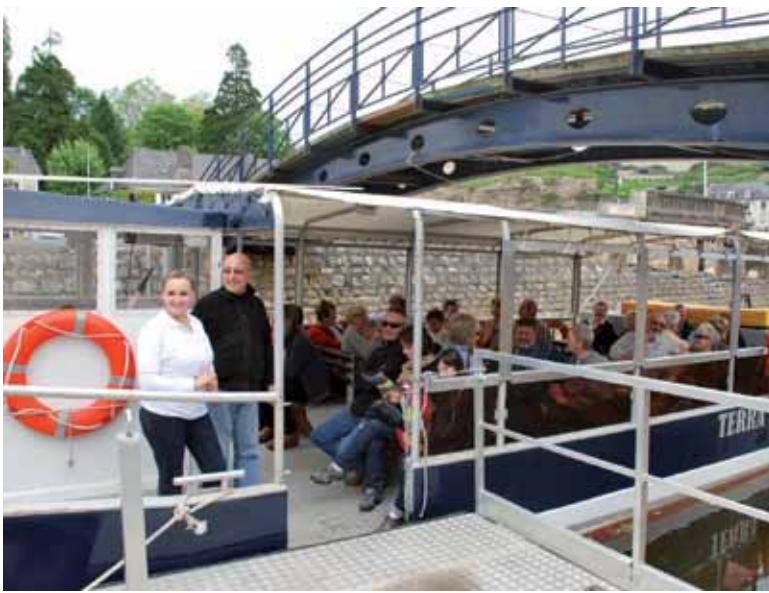
L'ancien bac du port de la Rochelle qui a transporté des centaines de milliers de passagers et trouve sur les berges de la Vézère une seconde jeunesse.

La concurrence de l'arrivée du rail en 1860 a mis fin à la batellerie en 1937 mais a annoncé un essor économique et industriel.