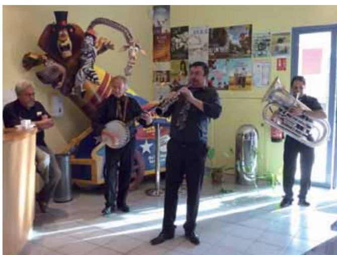
Un concert de jazz New Orleans a suivi le cycle «Filmer le jazz»